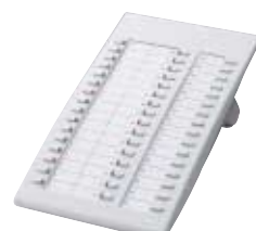
■ KX-T7740 Consola DSS