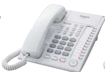
■ KX-T7720 Unidad con Altavoz