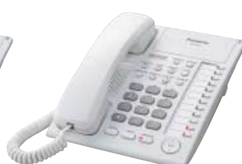
■ KX-T7750 Unidad con Monitor