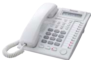
■ KX-T7730 Unidad con LCD y Altavoz